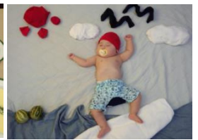
(左) 子どもの行事の様子や自身が作ったお弁当 (中) 産後退院前の産婦人科の食事 (右) 流行の寝相アートに挑戦した様子

新潟マーケティングリサーチ NIIGATA Marketing Research